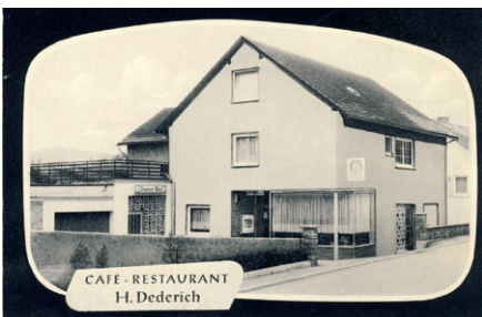
Archivfoto aus alten Tagen

Im Zuge der ersten Planungen wurde schnell deutlich, dass es zur Umsetzung der Maßnahme nicht lediglich mit einer Anpassung der Wohnfläche getan ist.