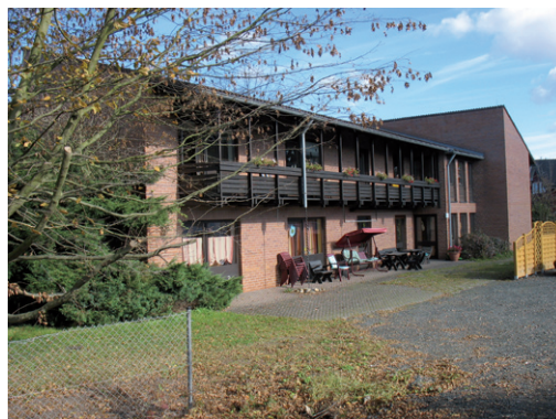
Rückseite Wohnheim heute

lich ist. Ein Schock war für uns allerdings die Nachricht, dass ein Teil der Gebäudeanlage aus statischen Gründen grundsätzlich nicht mehr sanierbar ist und durch einen Neubau ersetzt werden muss. Nicht zuletzt aufgrund der Lage des Wohnheimes mitten in einem Wohngebiet gestaltete sich der Abstimmungsprozess mit allen Beteiligten sehr aufwändig und nahm viel Zeit in Anspruch.